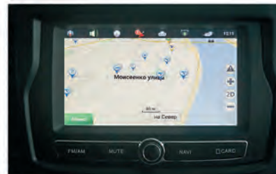
Режим навигации с функцией отображения дорожной обстановки в реальном времени (загрузка пробок)