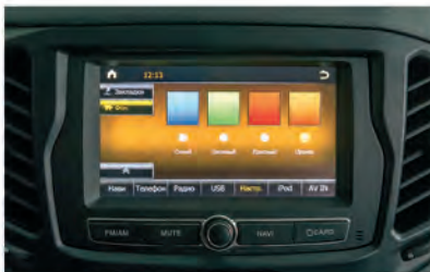
Выбор цвета меню