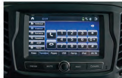
Режим телефона. Вы будете принимать звонки не отрываясь от вождения